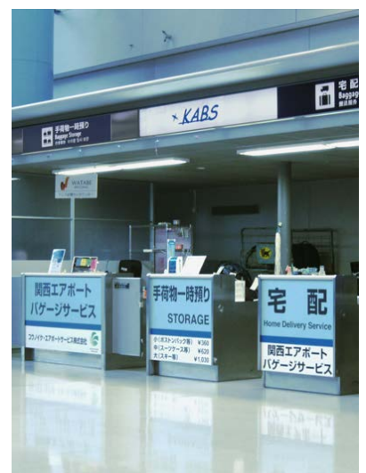
1階 到着ロビーカウンター