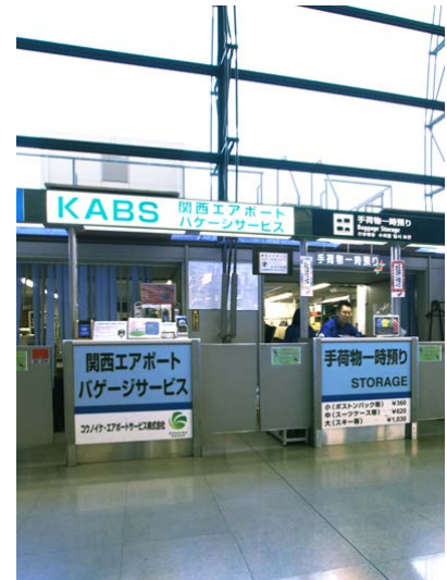
4階 出発ロビーカウンター